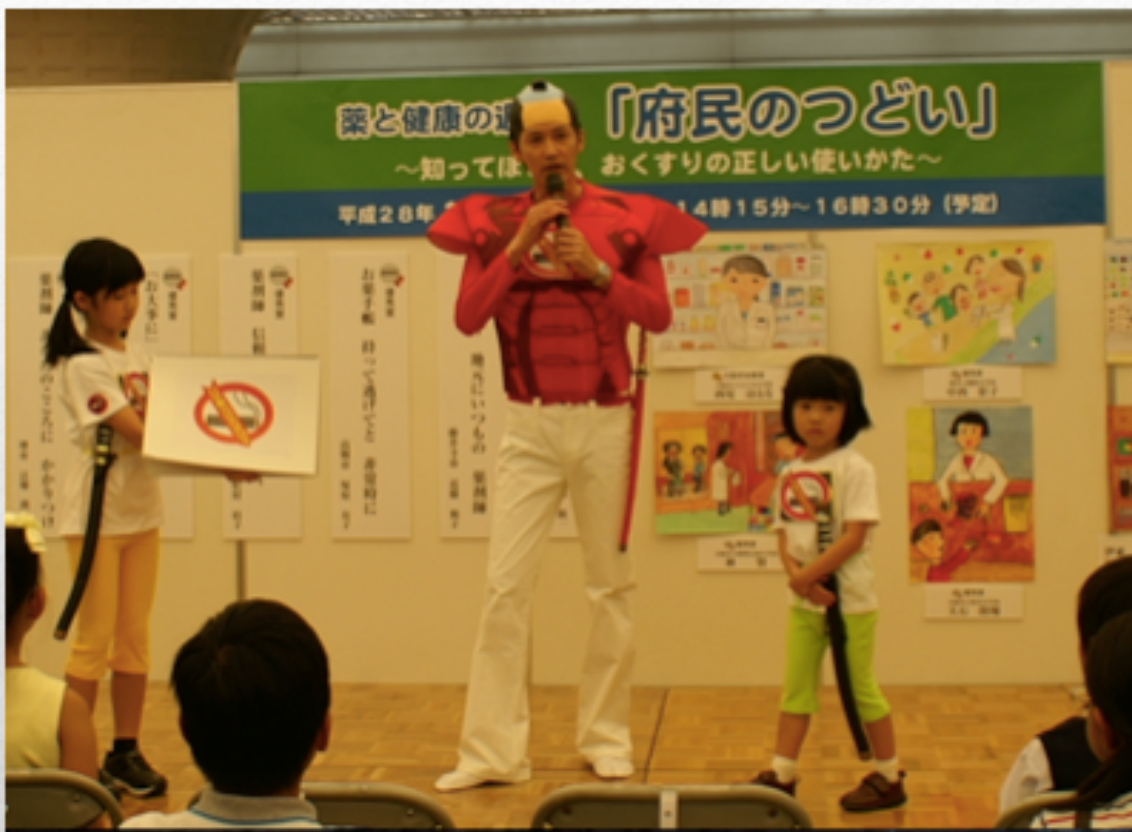
喫煙防止トークショー